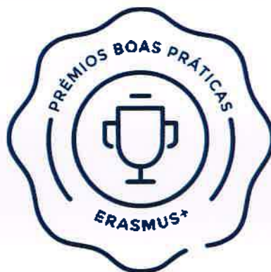
Figura 7 - Logotipo do Prémio Boas Práticas Erasmus+ - Juventude em Ação.

projeto temos o objetivo não só de capacitar os jovens, mas também de criar um manual de literacia financeira. Contamos com o excelente trabalho e parceria da Universidade do Porto (Portugal), associação PAR Institute (Croácia) e associação Amics (Espanha).