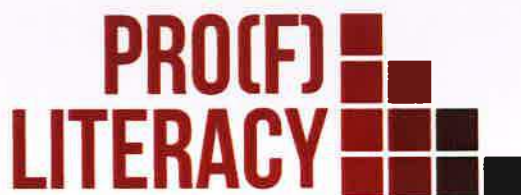
Figura 5 - Logotipo do projeto PRO(F)LITERACY- Competence Based Development Programme for Financial Literacy.

Neste projeto foram definidos os seguintes objetivos: 1) A literacia e gestão financeira, mediante a transferência de conhecimentos e de práticas, metodologias, métodos e ferramentas para início de novas formas de pensar e agir; 2) A capacitação dos jovens, mediante o desenvolvimento de competências chave em empreendedorismo (sobretudo literacia económica e financeira) e a adoção de pensamentos e atitudes empreendedoras; 3) A capacitação dos técnicos de juventude, mediante a transferência de novos conhecimentos, práticas, metodologias e métodos de trabalho com e para os jovens no espectro da literacia financeira e na aquisição de competências chave; 4) A incorporação de metodologias participativas e inclusivas no trabalho jovem (como a Educação Não Formal) e as suas potencialidades no complemento às demais metodologias (como a Educação Informal e Formal); 5) A inclusão social, incluindo os grupos sub-representados, mediante a criação de oportunidades de capacitação.