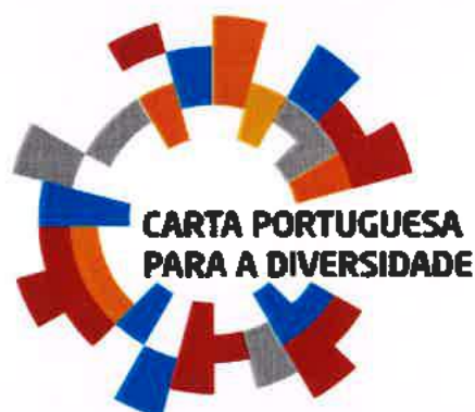
Figura 2 - Logotipo da Carta Portuguesa para a Diversidade.

Em linha com a estratégia de envolvimento da associação com a sociedade, decidimos passar a ser signatários da carta para a diversidade, no âmbito do nosso pilar estratégico de inclusão social e diversidade.