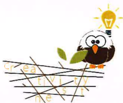
Figura 6 - Logotipo do projeto CREATIVITY NEST.

Por fim, o projeto denominado de CREATIVITY NEST (2020-1-PT02-KA227-YOU-007625), candidatado e aprovado em 2020 e que será para implementar entre 2022 e 2023.